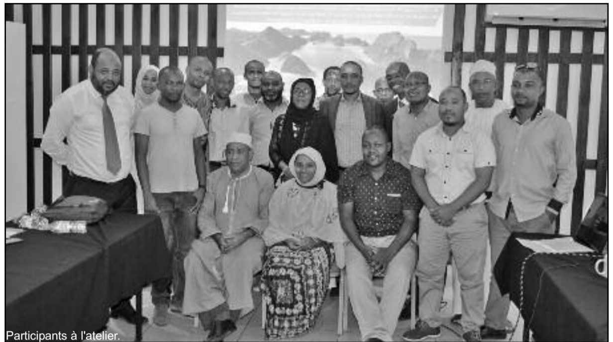
Participants à l'atelier.

Il faut noter qu'en vertu du paragraphe 84 de la décision de la Conférence des Parties adoptant l'Accord de Paris, il a été décidé de créer «une initiative de renforcement des capacités pour la transparence afin de renforcer les capacités institutionnelles et techniques, avant et après 2020». C'est dans ce contexte que le Fonds pour l'environnement mondial, le CBIT est proposé pour soutenir des activités alignées sur ces objectifs aux